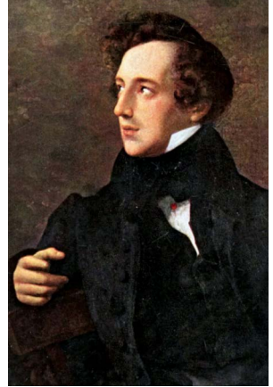
Portrait de Félix Mendelssohn peint par Wilhelm Hensel (1794-1861).

Impossible de terminer un concert avec plus de brio qu'en jouant la musique de chambre de Félix Mendelssohn (1809-1847). Compositeur allemand, chef d'orchestre, pianiste, organiste, Mendelssohn est un enfant prodige qui est déjà reconnu en Europe dans les années 1830 alors qu'il commence sa vingtaine. Dans les années 1840, il est reconnu comme l'un des musiciens les plus importants en Allemagne. Il compose son Trio pour piano n° 1 en 1839. C'est une pièce dramatique mais gracieuse, avec un allant qui n'empêche pas l'œuvre d'avoir beaucoup de finesse. Robert Schumann (1810-1856), compositeur allemand mythique de la même époque et critique actif dans la presse, aurait appelé Mendelssohn le « Mozart du 19 e siècle » pour l'élégance de son Trio . Malgré tout cela, Mendelssohn est moins reconnu que d'autres compositeurs allemands, un fait que des musicologues et interprètes essaient de corriger. Dans la deuxième moitié du 19 e siècle, le style musical de Mendelssohn, où se mêlent les esthétiques des époques romantique et classique, n'était plus en vogue. Au 20 e siècle, le régime nazi bannit sa musique puisqu'il était d'origine juive. Tout cela a certainement coûté à Mendelssohn une part de la reconnaissance qui lui revient de droit, mais la beauté de sa musique le sauvera sans aucun doute de l'oubli.