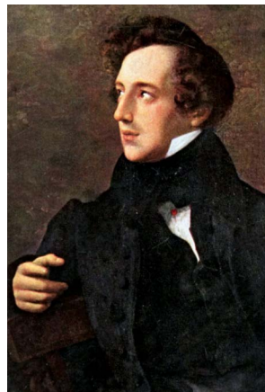
Portrait of Felix Mendelssohn painted by Wilhelm Hensel (1794-1861).

There is no better way to end a concert with more brilliance than by playing the chamber music of Felix Mendelssohn (1809-1847). A German composer, conductor, pianist, and organist, Mendelssohn was a child prodigy already recognized in Europe in the 1830s when he was in his twenties. By the 1840s, he was acknowledged as one of the most important musicians in Germany. He composed his Piano Trio No. 1 in 1839. It is a dramatic yet graceful piece, with momentum that does not prevent the work from having much finesse. Robert Schumann (1810-1856), a legendary German composer of the same era and an active critic in the press, called Mendelssohn the "Mozart of the 19 th century" for the elegance of his Trio . Despite all this, Mendelssohn is less recognized than other German composers, a fact that musicologists and performers are trying to correct. In the second half of the 19 th century, Mendelssohn's musical style, blending romantic and classical aesthetics, fell out of vogue. In the 20 th century, the Nazi regime banned his music due to his Jewish heritage. All this undoubtedly cost Mendelssohn a share of the recognition he rightfully deserves, but the beauty of his music will undoubtedly save him from oblivion.